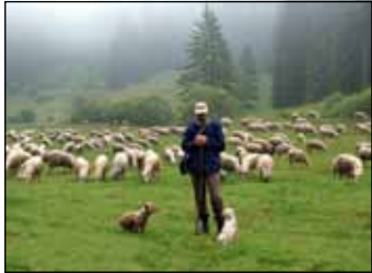
Snímky z vernisáže výstavy