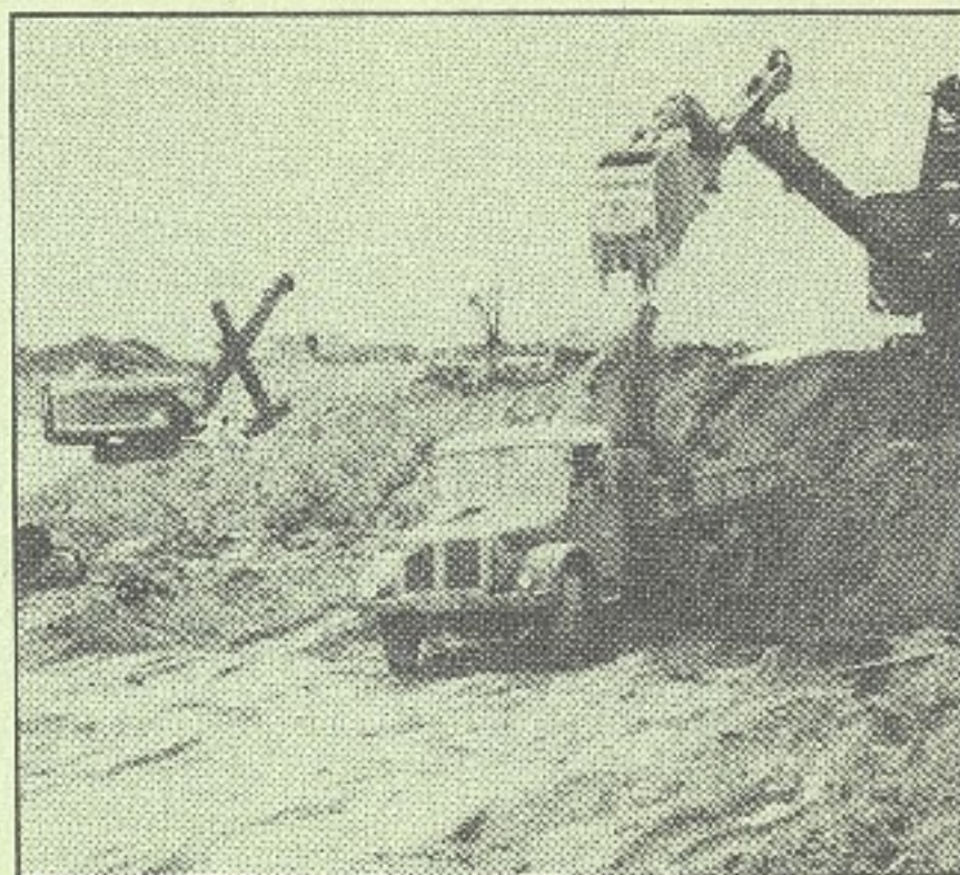
Neuveriteľné začiatky dnešného papierenského gigantu

Záverom ako "ideový spoluvlastník" tohto mohutného diela v našom kraji vyslovujem presvedčenie, že na